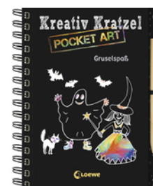
Kreativ-Kratzel Pocket Art: Gruselspaß