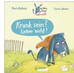
Der kleine Esel Liebernicht - Krank sein? Lieber nicht!