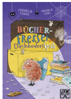
Bücherfresser und Dachbodenspuk