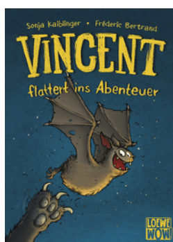
Vincent flattert ins Abenteuer (Band 1)