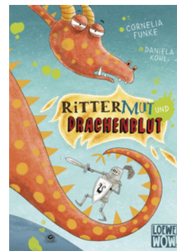
Rittermut und Drachenblut