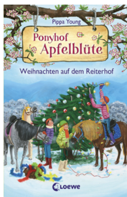
Ponyhof Apfelblüte - Weihnachten auf dem Reiterhof