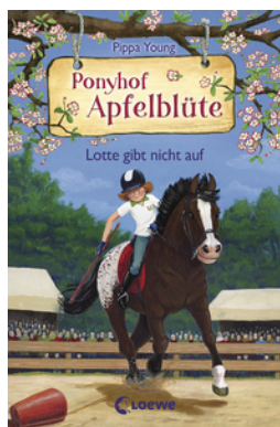
Ponyhof Apfelblüte (Band 23) - Lotte gibt nicht auf