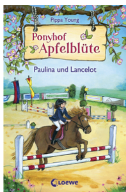
Ponyhof Apfelblüte (Band 2) - Paulina und Lancelot