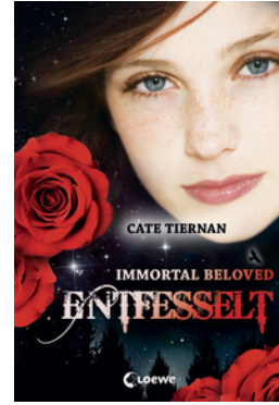
Immortal Beloved (Band 3) – Entfesselt