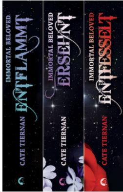
Immortal Beloved – Die komplette Trilogie