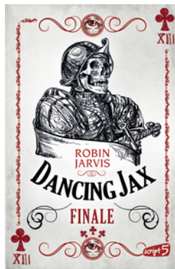
Dancing Jax – Finale