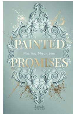
Painted Promises (Golden Hearts, Band 3)