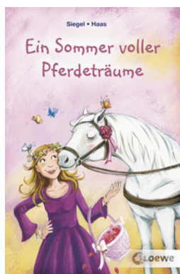
Ein Sommer voller Pferdeträume