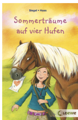
Sommerträume auf vier Hufen