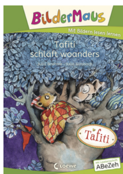
Bildermaus - Tafiti schläft woanders