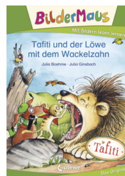
Bildermaus - Tafiti und der Löwe mit dem Wackelzahn