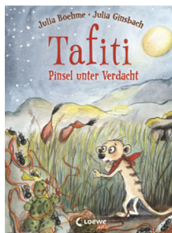
Tafiti (Band 22) - Pinsel unter Verdacht