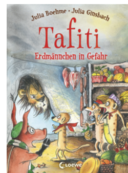
Tafiti (Band 23) - Erdmännchen in Gefahr