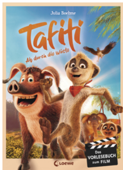
Tafiti - Ab durch die Wüste