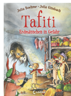
Tafiti (Band 23) - Erdmännchen in Gefahr