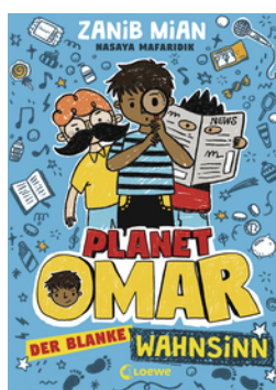
Planet Omar (Band 2) - Der blanke Wahnsinn