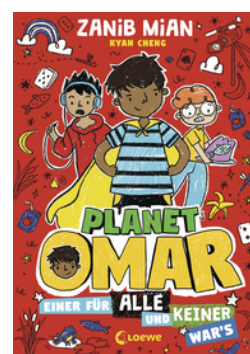
Planet Omar (Band 4) - Einer für alle und keiner war's