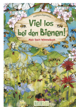
Viel los bei den Bienen!