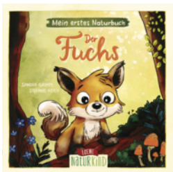
Mein erstes Naturbuch - Der Fuchs