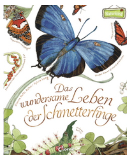
Das wundersame Leben der Schmetterlinge