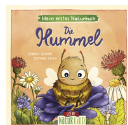
Mein erstes Naturbuch - Die Hummel