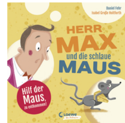
Herr Max und die schlaue Maus