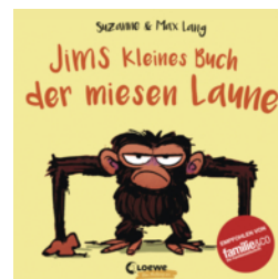
Jims kleines Buch der miesen Laune