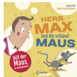
Herr Max und die schlaue Maus