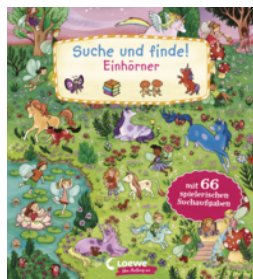
Suche und finde! Einhörner