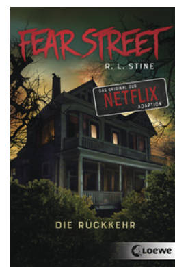
Fear Street - Die Rückkehr