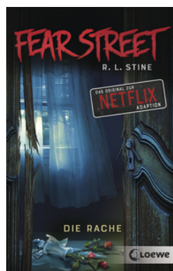
Fear Street - Die Rache