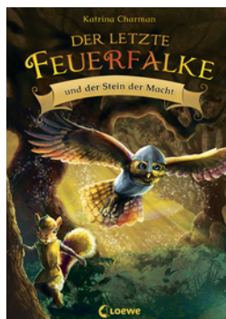
Der letzte Feuerfalte und der Stein der Macht (Band 1)