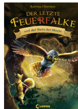
Der letzte Feuerfalte und der Stein der Macht (Band 1)