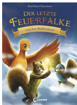
Der letzte Feuerfalte und das Wolkenland (Band 7)