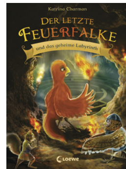
Der letzte Feuerfalke und das geheime Labyrinth (Band 10)