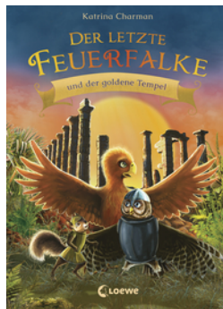
Der letzte Feuerfalke und der goldene Tempel (Band 9)