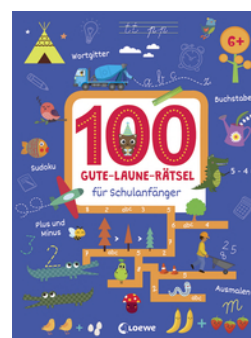
100 Gute-Laune-Rätsel für Schulanfänger