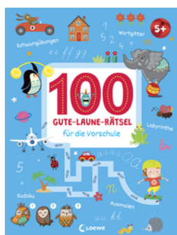
100 Gute-Laune-Rätsel für die Vorschule