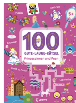
100 Gute-Laune-Rätsel - Prinzessinnen und Feen