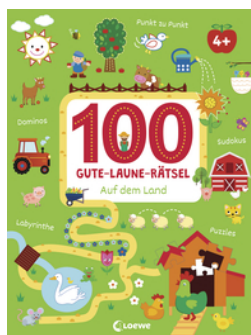
100 Gute-Laune-Rätsel - Auf dem Land