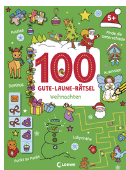
100 Gute-Laune-Rätsel - Weihnachten