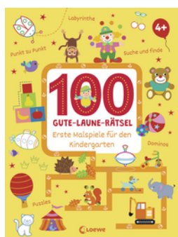
100 Gute-Laune-Rätsel - Erste Malspiele für den Kindergarten