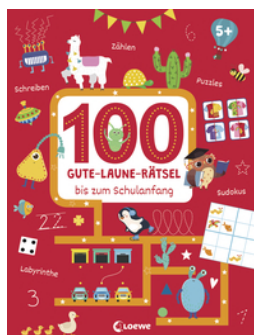
100 Gute-Laune-Rätsel bis zum Schulanfang