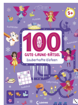
100 Gute-Laune-Rätsel - Zauberhafte Eisfeen