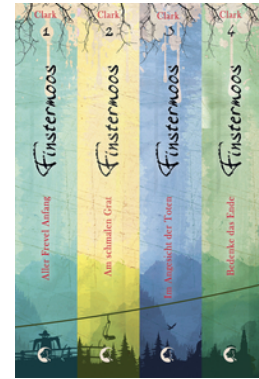
Finstermoos - Die komplette Reihe inkl. eShort