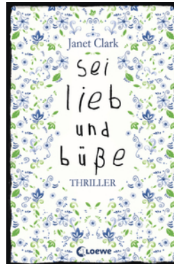
Sei lieb und büße