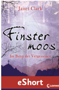
Finstermoos – Im Bann der Vergessenen