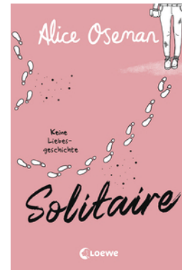
Solitaire (deutsche Ausgabe)