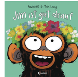
Jim ist gut drauf