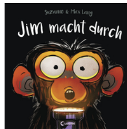
Jim macht durch