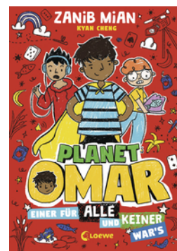
Planet Omar (Band 4) - Einer für alle und keiner war's