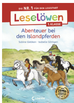
Leselöwen 1. Klasse - Abenteuer bei den Islandpferden