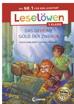
Leselöwen 1. Klasse - Das geheime Gold der Zwerge (Großbuchstabenausgabe)