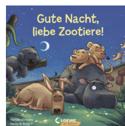
Gute Nacht, liebe Zootiere!