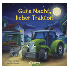
Gute Nacht, lieber Traktor!