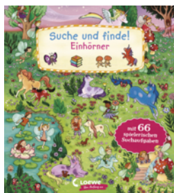
Suche und finde! Einhörner