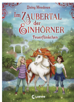
Im Zaubertal der Einhörner (Band 1) - Feuerfünkchen