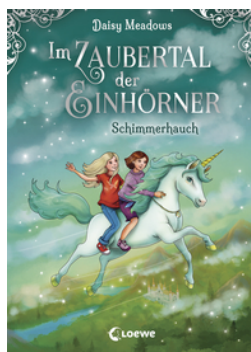
Im Zaubertal der Einhörner (Band 2) - Schimmerhauch