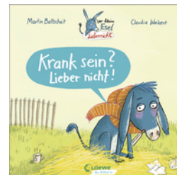
Der kleine Esel Lieber nicht - Krank sein? Lieber nicht!