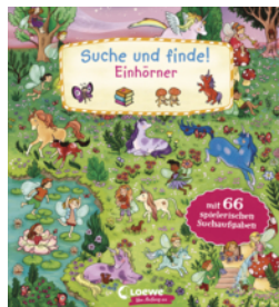
Suche und finde! Einhörner