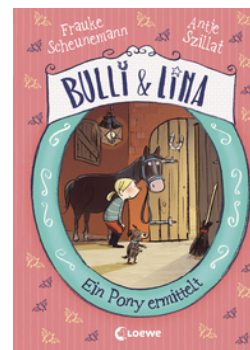
Bulli & Lina (Band 4) - Ein Pony ermittelt