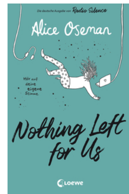
Nothing Left for Us (deutsche Ausgabe von Radio Silence)