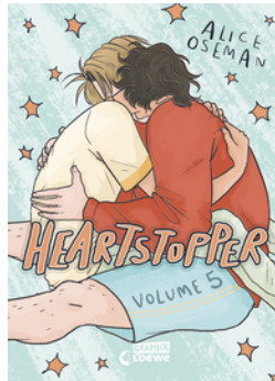
Heartstopper Volume 5 (deutsche Hardcover-Ausgabe)