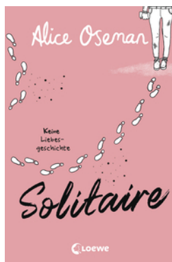
Solitaire (deutsche Ausgabe)