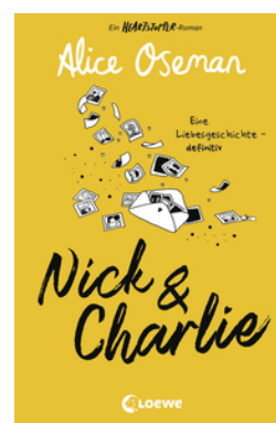
Nick & Charlie (deutsche Ausgabe)