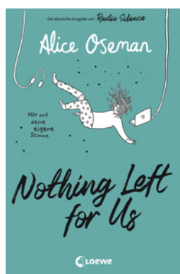
Nothing Left for Us (deutsche Ausgabe von Radio Silence)