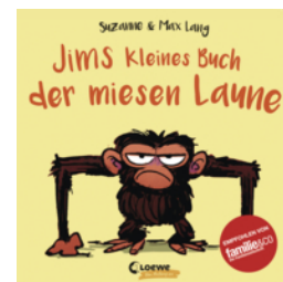
Jims kleines Buch der miesen Laune