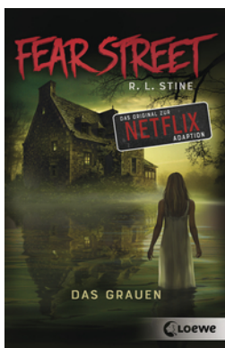
Fear Street - Das Grauen