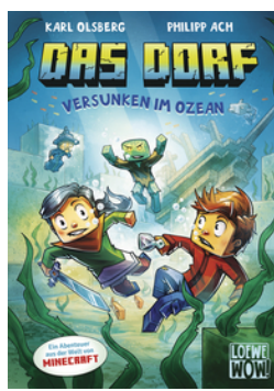
Das Dorf (Band 5) - Versunken im Ozean