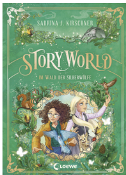
StoryWorld (Band 2) - Im Wald der Silberwölfe