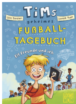
Tims geheimes Fußball- Tagebuch (Band 1) - Elf Freunde und ich!