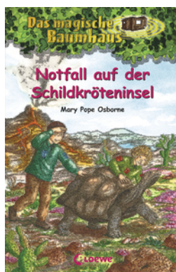
Das magische Baumhaus (Band 62) - Notfall auf der Schildkröteninsel