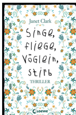
Singe, fliege, Vöglein, stirb