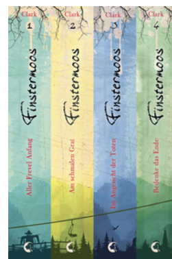
Finstermoos - Die komplette Reihe inkl. eShort