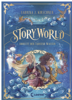
StoryWorld (Band 1) - Amulett der Tausend Wasser