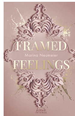
Framed Feelings (Golden Hearts, Band 1)