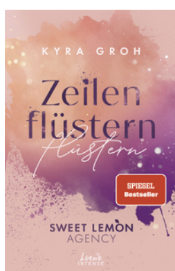
Zeilenflüstern (Sweet Lemon Agency, Band 1)