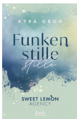
Funkenstille (Sweet Lemon Agency, Band 3)