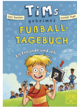
Tims geheimes Fußball- Tagebuch (Band 1) - Elf Freunde und ich!