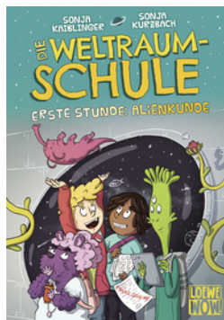
Die Weltraumschule (Band 1) - Erste Stunde: Alienkunde