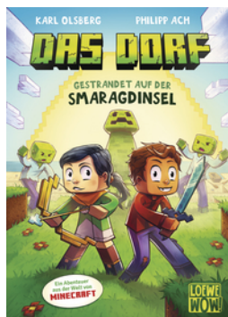
Das Dorf (Band 1) - Gestrandet auf der Smaragdinsel