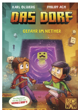
Das Dorf (Band 2) - Gefahr im Nether