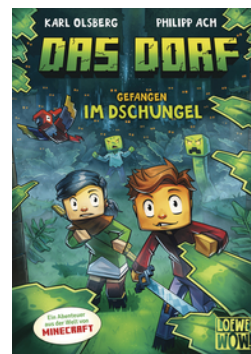
Das Dorf (Band 3) - Gefangen im Dschungel