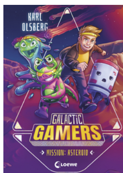
Galactic Gamers (Band 2) - Mission: Asteroid