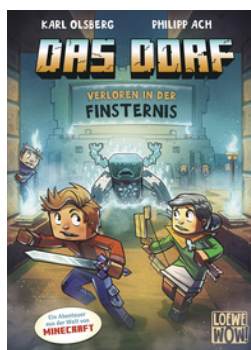
Das Dorf (Band 6) - Verloren in der Finsternis