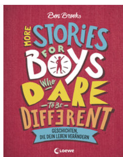
More Stories for Boys Who Dare to be Different - Geschichten, die dein Leben verändern