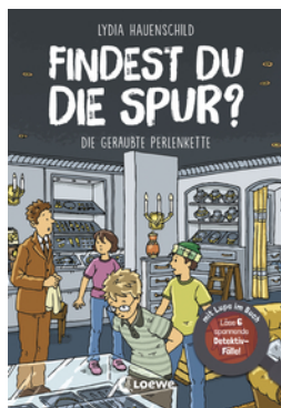
Findest du die Spur? - Die geraubte Perlenkette