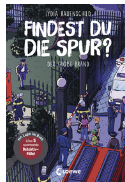
Findest du die Spur? - Der große Brand