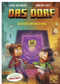
Das Dorf (Band 2) - Gefahr im Nether