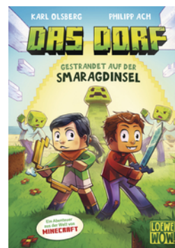
Das Dorf (Band 1) - Gestrandet auf der Smaragdinsel