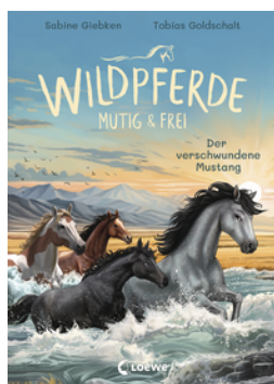
Wildpferde - mutig und frei (Band 4) - Der verschwundene Mustang