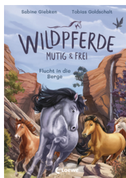
Wildpferde - mutig und frei (Band 3) - Flucht in die Berge