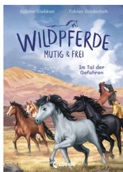
Wildpferde - mutig und frei (Band 2) - Im Tal der Gefahren