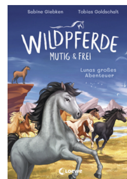
Wildpferde - mutig und frei (Band 1) - Lunas großes Abenteuer