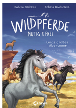
Wildpferde - mutig und frei (Band 1) - Lunas großes Abenteuer