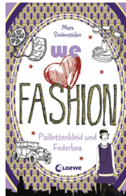
we love fashion (Band 3) – Paillettenkleid und Federboa