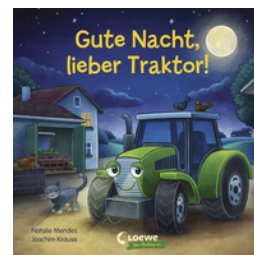
Gute Nacht, lieber Traktor!