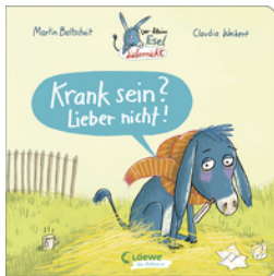
Der kleine Esel Liebernickt - Krank sein? Lieber nicht!