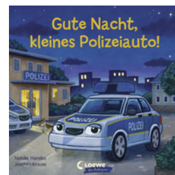
Gute Nacht, kleines Polizeiauto!