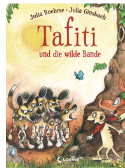
Tafiti und die wilde Bande (Band 20)