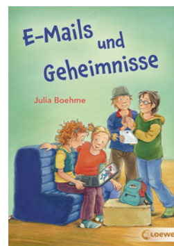
E-Mails und Geheimnisse