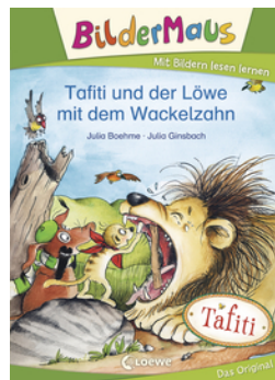
Bildermaus - Tafiti und der Löwe mit dem Wackelzahn