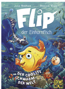
Flip, der Einhornfisch (Band 1) - Der coolste Schwarm der Welt