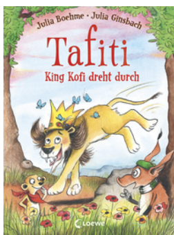
Tafiti - King Kofi dreht durch (Band 21)