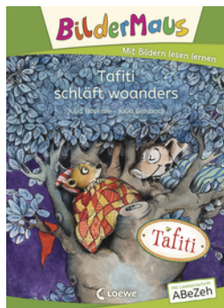
Bildermaus - Tafiti schläft woanders