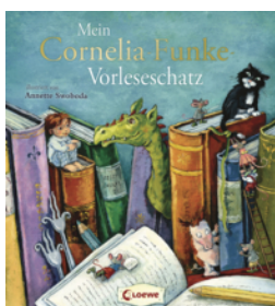
Mein Cornelia-Funke- Vorleschatz